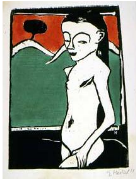
ئېرىك ھېكل، مەنالىكى وەستەو، ۱۹۱۰، كۆلېنى تەختە، ۲۷ × ۲۷ سەم.