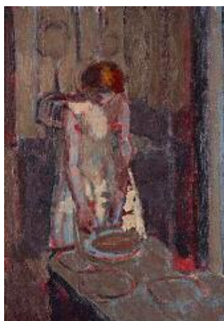
ولتر سیکرت، چیشخانہی فہرہنسی، ۱۹۱۰، روئی لہسہر کانتاس، ۹۷ × ۴۲ شم.