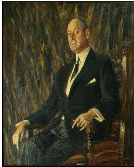
نوکستس جوں، جوزیف ښی، ۱۹۲۱، پوښی له سهه ركانشاس، ۱۲۴ × ۱۰۲ سم.