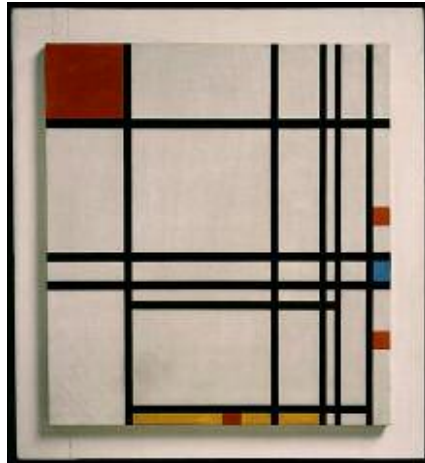
پىت مۇندريان، كۇمپۇزشۇن ژمارە ھەشت، ۱۹۲۹، رۇنى نەسەر كانئاس، ۶۷ × ۷۴ سم.