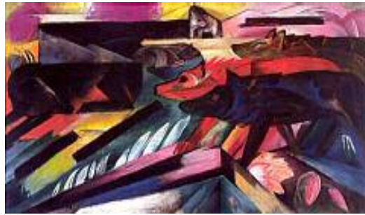
فرانز مارك، گورگەكان، ۱۹۱۲، رۇنى نەسەر كانقاس، ۲۷ × ۵۵ ئىنچ.