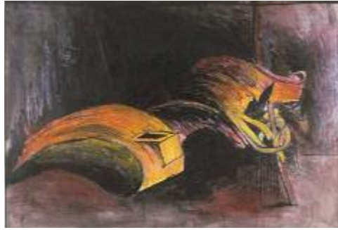
گراھام سوزەرلاند، ھەواکېشى کارگەيەك و پۇڭھەھەلات، ۱۹۲۱، بۆيەي ئاوى، ۶۷ × ۴۷ سەم.