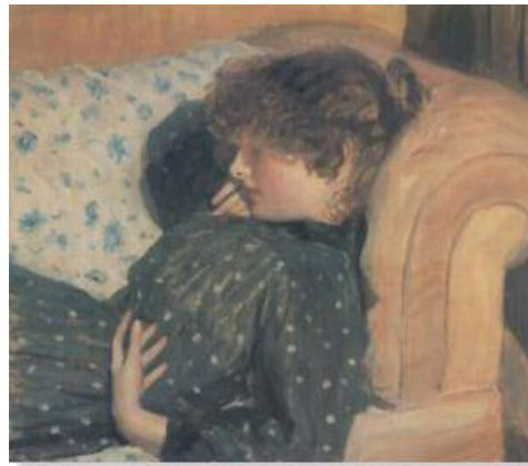
ولسن ستىر، كچىك ئەسەر قەنەقە، ۱۸۹۱، رۇنى ئەسەر كانقاس، ۶۱ × ۵۶ سم.