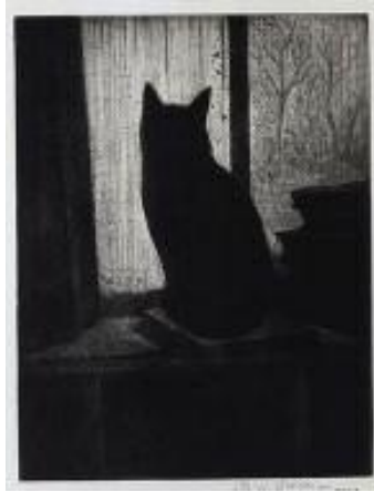
نيقسن، پشيله يەك، ۱۹۲۱، ئەكواتت و ئىچىنگ، ۲۵ × ۴۰ سم.