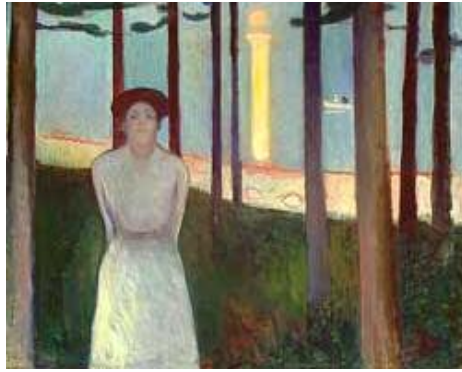
ئەدوارد مۇنش، خەونى شەويكى ھاوېن، ۱۸۹۲، رۇتتى ئەسەر كانتاس، ۸۷×۱۰۸سم