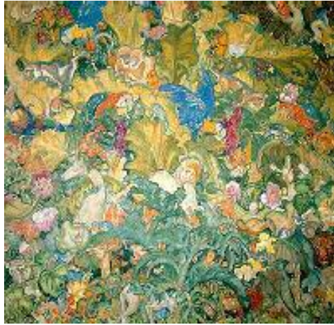
فرانك برا نچۇن، ئىمپۇراتۇرىيە تى برىتانى، ئەسەر تەختە، ۱۹۲۵-۳۰.