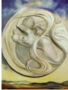
سلفادۇر دالى، فەزاي ھەوا، ۱۹۷۲، پۇن لەسەر كاتشاس، ۵۸،۷ × ۲۶، ۳ سم.