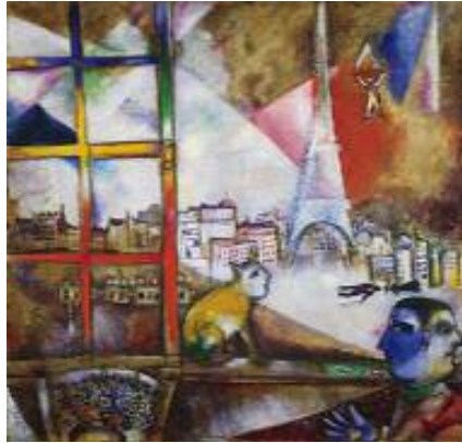
مارك شاگال، پاریس له په نچه روهه، ۱۹۱۲، پوښی له سهه ركانشاس، ۵۳ × ۵۵ ښیچ.