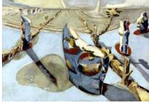
پۇن'ناش، بارزىدەيەكى لىسۇگرافى تىك چاپ - ۱۹۳۸.