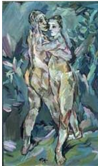
ئوسكار كۇكۇشكا، دووخۇشەويستى روت، ۱۹۱۲، رۇنى ئەسەر كانتاس، ۹۷×۱۶۳سم