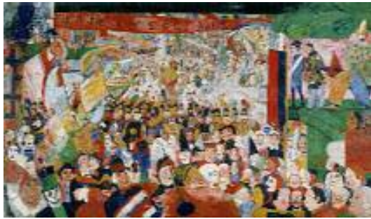
جىمىس ئانسۇر، ھاتتە ژوردەوى مەسىچ بۇ بروسىلر، ۱۸۸۹، دۇنى ئەسەر كانتاس، ۹۹ × ۱۶۹ ئىنچ.