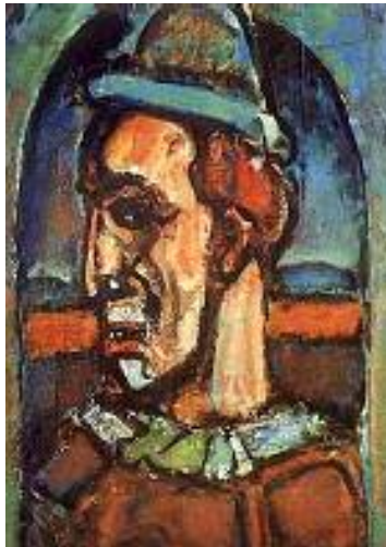
جورج رووه، لېنيوك، ۳۴×۵۰سم، رونی له سهر پوردی مقهبا