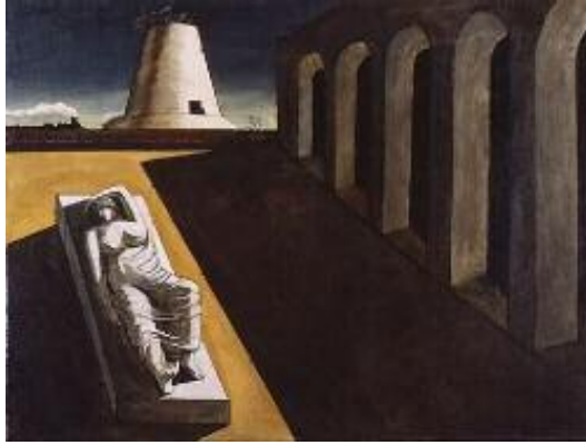
جىورجىيۇدى تشىرىكۆ، ئارىادن، ۱۹۱۳، مەركەب و زەيت ئەسەر كانتاس، ۱۳۵ × ۱۸۰ سم.