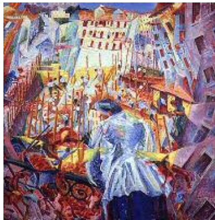
ئەمبەرتۇ بۇتشيونى، شەقامەكە ئەنيو مائەكەدا، رۇنى نەسەر كانئاس، ۱۰۰ - ۱۰۶ سم.