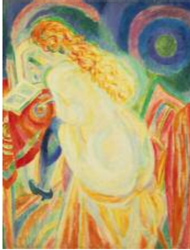
رۇبەرت دىلانۇى، كچىكى روت دەخوئىنئىتەو، ۱۹۱۵، رۇنى نەسەر كانقاس، ۴۲×۵۴ ئىنچ