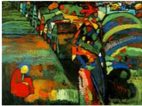
فاسیلی کاندنسی، نیگارکیشان به خانوو، ۱۹۰۹، ۹۸ × ۱۲۳ سم.