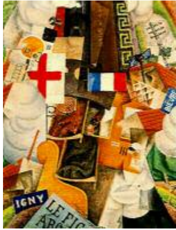
پېنۇ سېفريني، کارگوزاری نه خوشخانه، ۱۹۱۵، ۱۱۷×۹۰سم