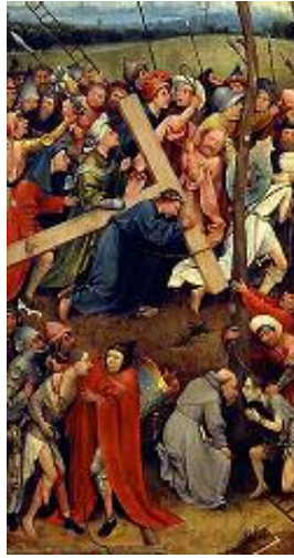
جېرۇم بوش، مەسىح خاچى ھەنگرتووه، ۱۴۸۰-۱۴۹۰، تەختە، ۵۷ × ۲۲ سم.