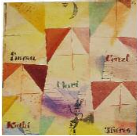
پۆل کلی، دۆن جیپوفانی باشاری، ۱۹۱۹، بۆیهی ناوی و مهرهکهب له سههر کاغهن، ۸۷ × ۸۷ ئینچ.