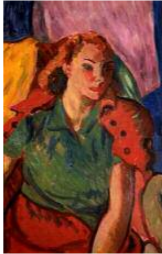
ماتىوسەت، كچىك ئە بلوزىكى گونجاودا، ۱۹۴۱، رۇنى، ۶۰ × ۹۳ سم.