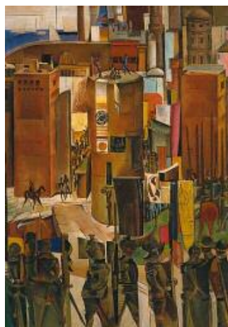
ویندھام لوئیس، چواردهوری بہرشلونہ، ۱۹۳۴.