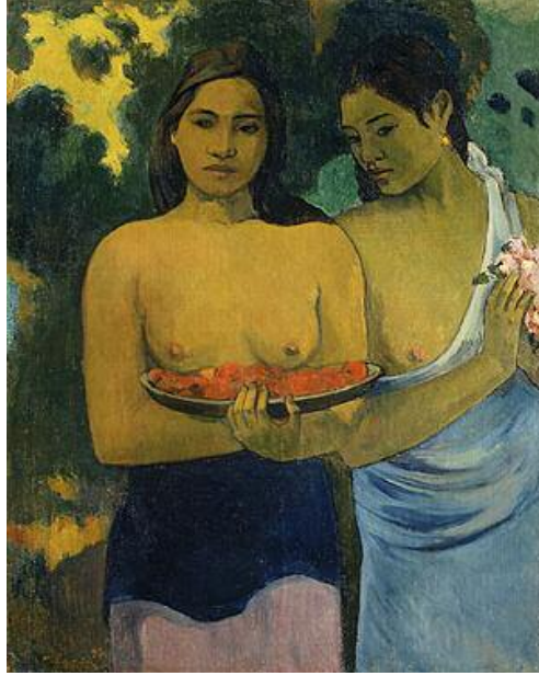
پۇل گۇگان، دو ئافرىقى تاهىتى، ۱۸۹۹، رۇنى ئەسەر كە ئىقاس، ۹۲×۷۳ سەم