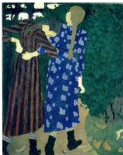
نه دوارد فيلارد، كچه لاونيك پياسه ده كات، ۱۸۹۰، رونی له سر كانقاس، ۶۵×۸۱ سم