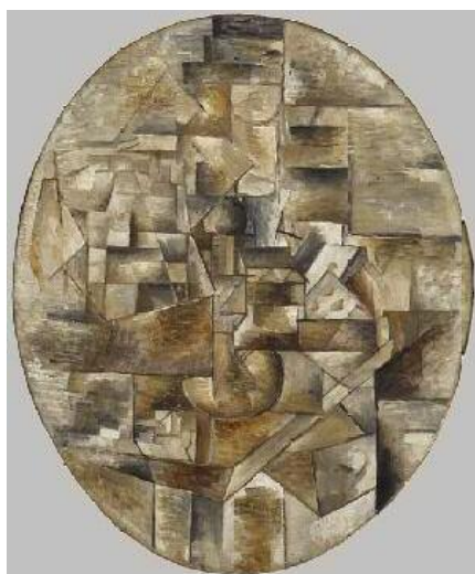
جۇرج براك، مۇمىدان ويارى كاغەز ئەسەر مېز، ۱۹۱۰، رۇنى ئەسەر كاتىقاس، ، ۶۰×۵۴سم