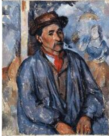
پۆل سىزان، پىاويك نە كراسىكى شىندا، ۱۸۹۶-۱۸۹۷،