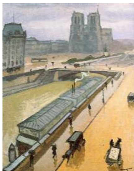
نهبيرت ماركيه، نه پوژيكي باراني پاريس، ۱۹۱۰ رۇني نەسەر كاتشاس، ۹۰×۱۰۶ سم