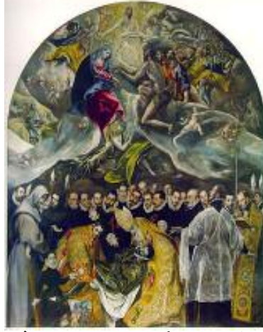
نەنگرىكۆ، ئاشتتى دىوك نۇرگاز، ۱۵۸۶، رۇنى نەسەر كانئاس،