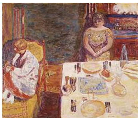
پير يونارد، پيش شيو، ۱۹۲۴، رونی له سر كه نقاس، ۱۰۶×۹۰ سم