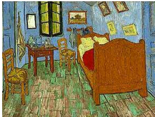
شان كوخ، ژوورى ئوستىنە كە، ۱۸۸۹، رۇنى ئەسەر كە ئىقاس، ۹۲×۷۳ سەم