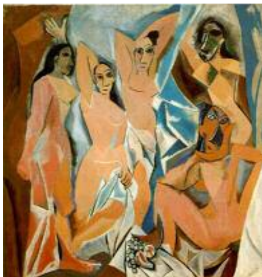
پابلۇ بېكاسۇ، ئافرىقىي ئىنسان، ۱۹۰۷، رۇنى ئەسەر كەڭلىكى،