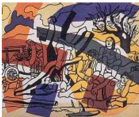
فرنارد لىجىيە، ئاھەنگ، ۱۹۵۴، ۲۶×۳۱ ئىنچ