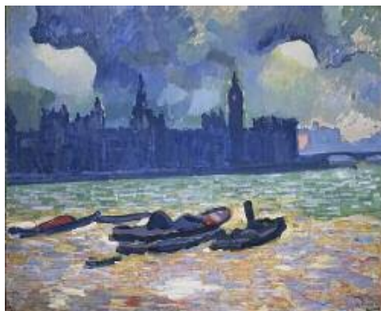
نه ندریه دیران، ماله کانی پانلیمیتت له شه ودا، ۱۹۰۵، رونی له سهر که نقاس ۹۹×۷۸ سم