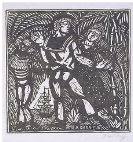
راول دۇفي، سه ما، ۱۹۱۰، كۆليني ته خته، ۳۱×۳۱ سم