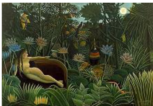
ھېنرى رۇسۇ، خەون، ۱۹۱۰، رۇنى ئەسەر كەڭلىكى، ۲۹۸ × ۲۰۴ سەم